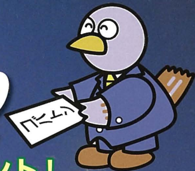
埼玉県のマスコット コウリン