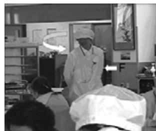
Fig. 1 周囲の観察

Availability と Reciprocity が表示されず、依頼がスムーズに行われない例も観察された。Fig. 3 では介護者 D は周囲を見渡しなが歩いているが、高齢者 C の視線を認識できずに C の横を通り過ぎる。高齢者 C は視線を介護者 D に向け続け、しばらくしてから介護者 D は後ろを振り返り、高齢者 C の視線に気づく。この観察でも、介護者 D は周囲に周囲に視線を向けることで Availability を表示し、高齢者 C の視線を引き付けているが、その視線の応答としての Reciprocity を表示することができずに、次の依頼のシーケンスに移行できていない。Availability と Reciprocity の表示には視線が多く使用されるが、お互いが視線を認識でき