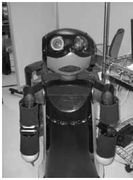
Fig. 4 Robovie-R Ver.2

る状況にしなければ, Availability と Reciprocity の表示が成功しないことがわかる。