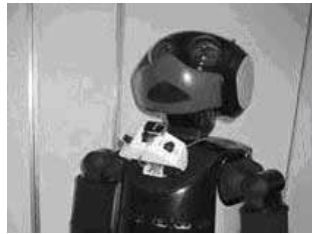
Fig. 5 頭部アイカメラと胸部の3台のUSBカメラ

Reciprocity の表示について, ロボットは依頼しようとしている人間に対して, その人間を特定したことを表現することが重要だと考える。人間での分析では, アイコンタクト, 依頼者に接近, 依頼者の名前を発話等, 多くのケース