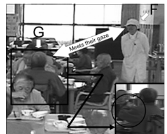
Fig. 2 依頼の受付開始