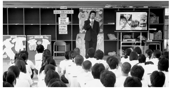
講演者Sさんの話をきく生徒