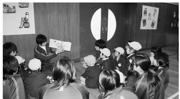
絵本の読み聞かせを行う生徒