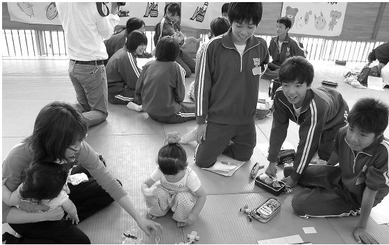
親子のかかわりをみている生徒