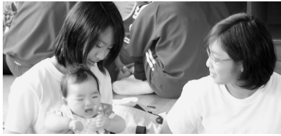
乳児をひざにのせてあやす生徒

した。いつか子どもを産んだ時ちゃんと育てられるように今日の体験を忘れず生かしていきたい。子どもを産むにはそれなりの苦労や覚悟が必要だと思うけど自分をここまで育ててくれた母を見習い良い母になりたい。