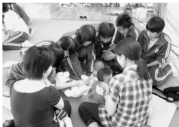
輪を小さくし乳児をのぞき込む生徒

さらに母親にとっての親子触れ合い授業は、育児そのもの子どもを賞賛してもらう機会となる。生徒は自分たちが「可愛い、すごい」と言うことが、その子のお母さんを喜ばせてもいることを知り、母親の日々の大変さと子育てのやりがいには周囲の人々のねぎらいや声掛けが必要なことを理解していく。家庭科教員としては事前指導をいかに細部にまで心砕いて行い、周囲の協力を得られるかでその体験の成果は驚くほど違いが出る。今後も多くの方々の協力を得ながら、より質の高い実践をめざしていきたい。