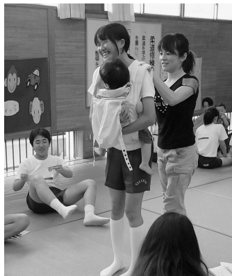
乳児を抱っこさせてもらう生徒