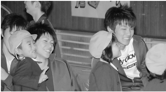
園児と「くっついたゲーム」を楽しむ生徒