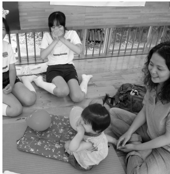
乳幼児と遊ぶ生徒