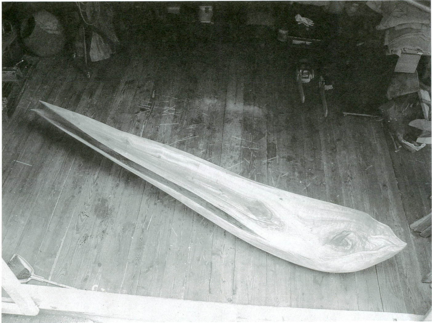
「あさつゆに」 3400×5400×560 mm クスノキ