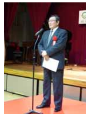
朝比奈豊氏(毎日新聞社長)による祝辞