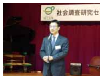
安田貴彦氏(内閣府審議官)による祝辞