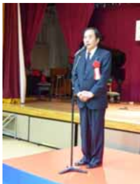
上田清司氏(埼玉県知事)による祝辞