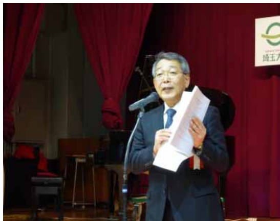
上井喜彦(埼玉大学長)による挨拶