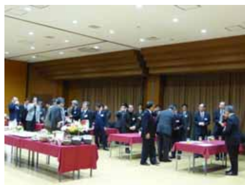
祝賀パーティーの様子