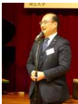
木内均氏(衆議院議員)による祝辞