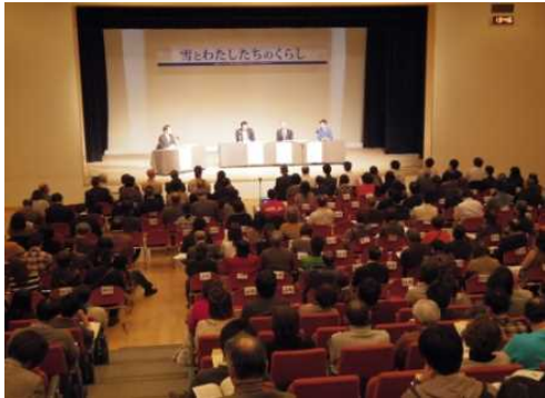
図7 専門家を交えた全体討議

全体会議では、「生活道路の雪対策を優先すべきではないか？」という質問に対し、まちづくりの専門家のパネリストから「雪を移動するにも膨大な費用がかかるため、あらかじめ除雪後の雪を置いておくスペースを地域に1つずつ作るなど、まちづくりの段階から雪対策を念頭におけばよいのではないか」というアイデアが示された。