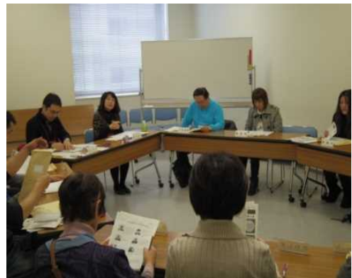
図6 小グループ討議

参加者はT2のアンケートに答えた後、15人程度の小グループに分かれて行う1時間半の討論と専門家が出席した全体会議を2セットこなした。司会をつとめるモデレーターは基本的に意見を挟まないため、市民だけで討論が成立するのかと、若干、心配したが、小グループ討議が始まるとまもなく参加者たちは打ち解け合い、自分の経験を元に、除雪に対する考え方や税金の使い道について熱の入った意見交換を始めた。