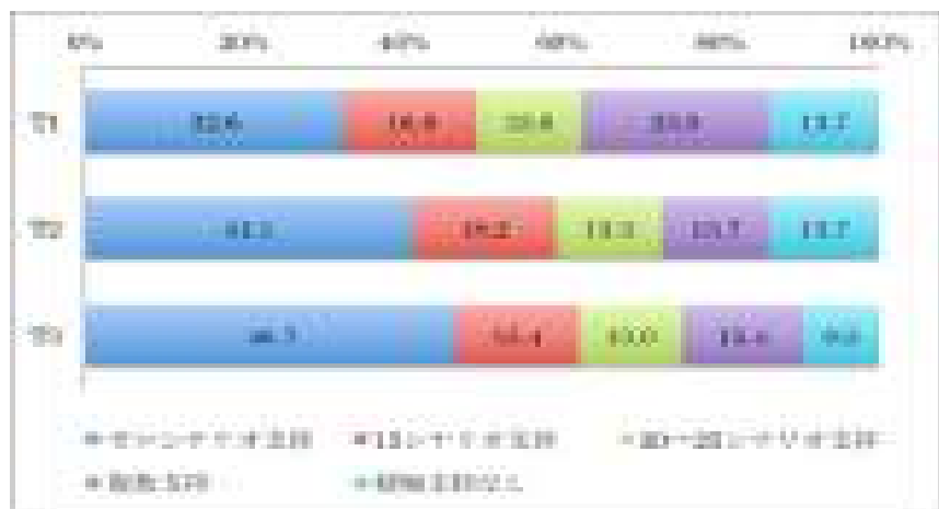
図4 討論参加者の原発に関する各シナリオの支持の変化 (調査報告書を元に作成)