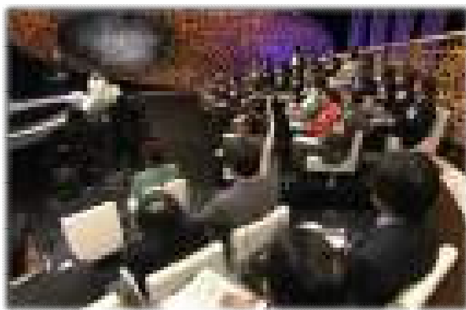
図 3 「日本のがん医療を問う」のスタジオ風景

さらに 80 年代後半には「テレビ世論調査」が始まった。この番組は無作為抽出した 20 才以上の国民 1,800 人のうち番組を視聴できる人に、識者や政治家による討論を視聴してもらうというものだった。番組内で質問を出し、電話で回答してもらった結果を即座に集計して発表するという機動性に飛んだ番組作りが視聴者からは好評だったと言われる。しかし、たとえ最初はランダムに選んだとしても、実際に回答するのは番組を視聴している人に限られるという点で大きなバイアスがあり、専門家からは世論調査と名付けることに対する批判も強かった。この手法はその後、NHK スペシャル「徹底討論」や「日本の課題」などに引き継がれ、96 年まで活用されたが、いずれも市民が討論するのではなく、市民はあくまでも調査の対象でしかなかった（村上圭子・荒牧央，2011）。