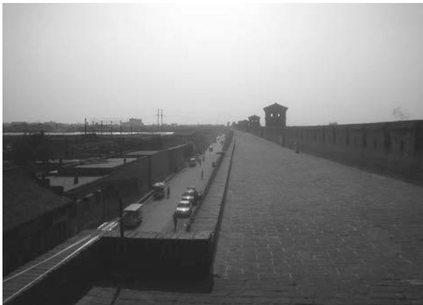
写真2 平遙故城城壁