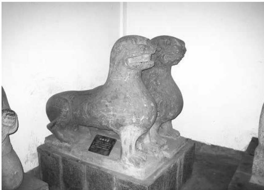
写真23 孟津出土北魏石像