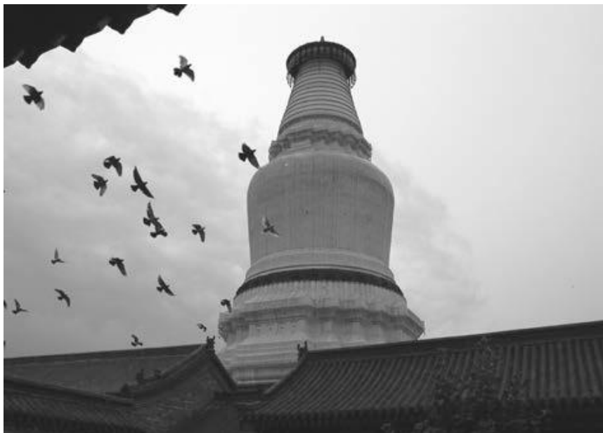
写真13 顕通寺の仏塔