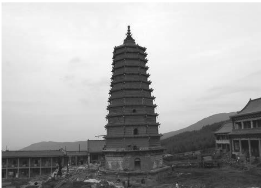
写真12 獅子窩瑠璃塔