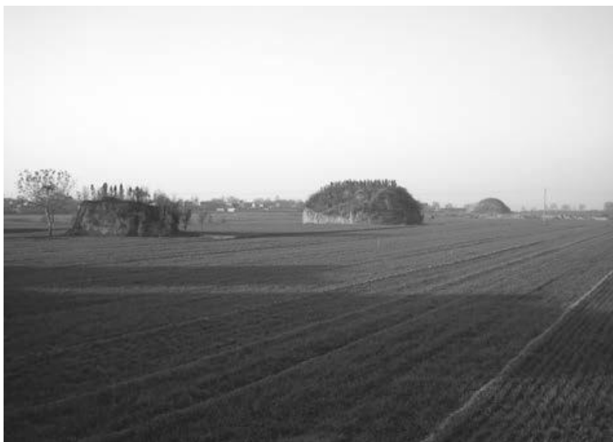
写真24 洛陽北郊古墓群