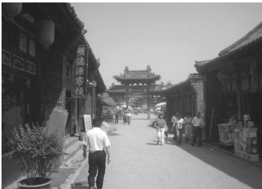
写真3 平遙故城城內