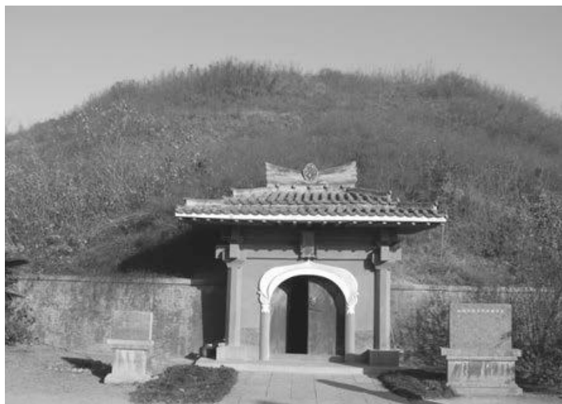
写真20 古墓博物館内の景陵