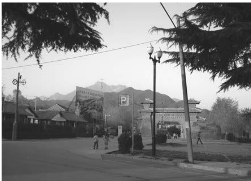
写真 17 山麓から天壇山を見る