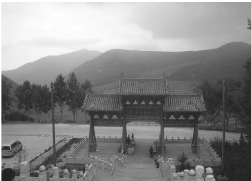
写真8 金閣寺から山門を見る