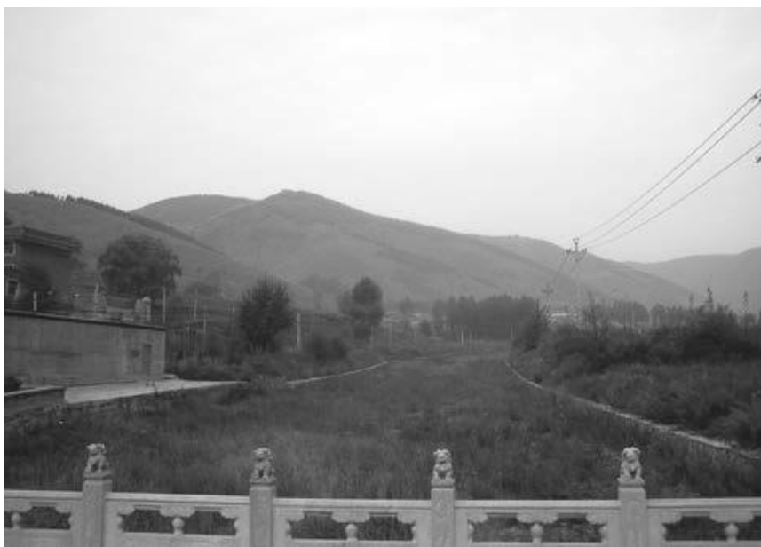
写真9 五台山中の景観