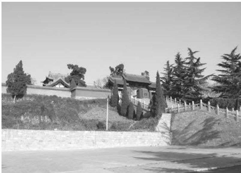
写真 16 陽台宮