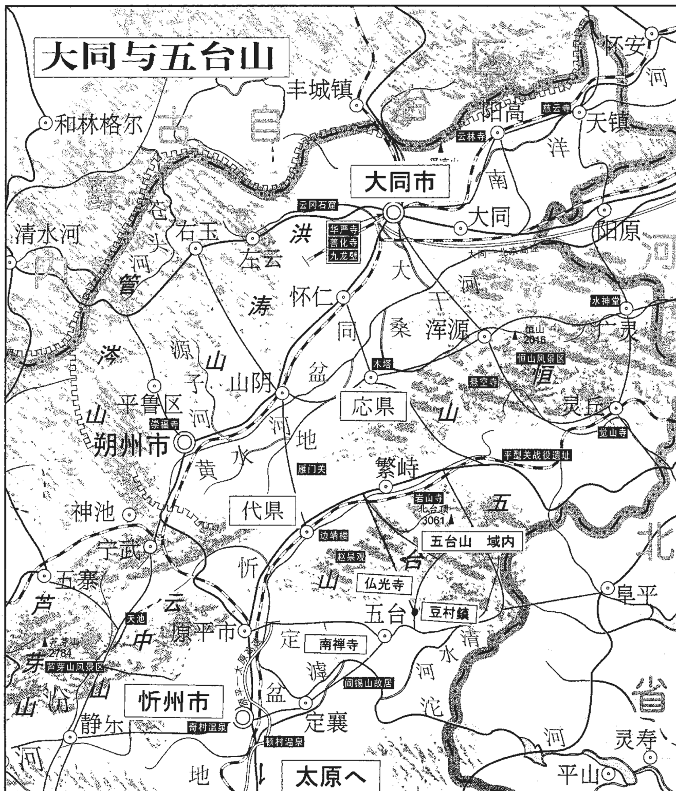
図1 五台山とその周辺